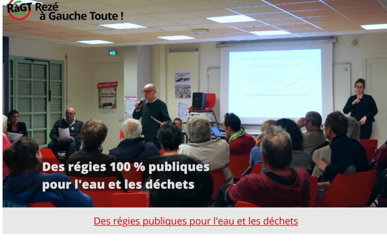
Des régies publiques pour l'eau et les déchets