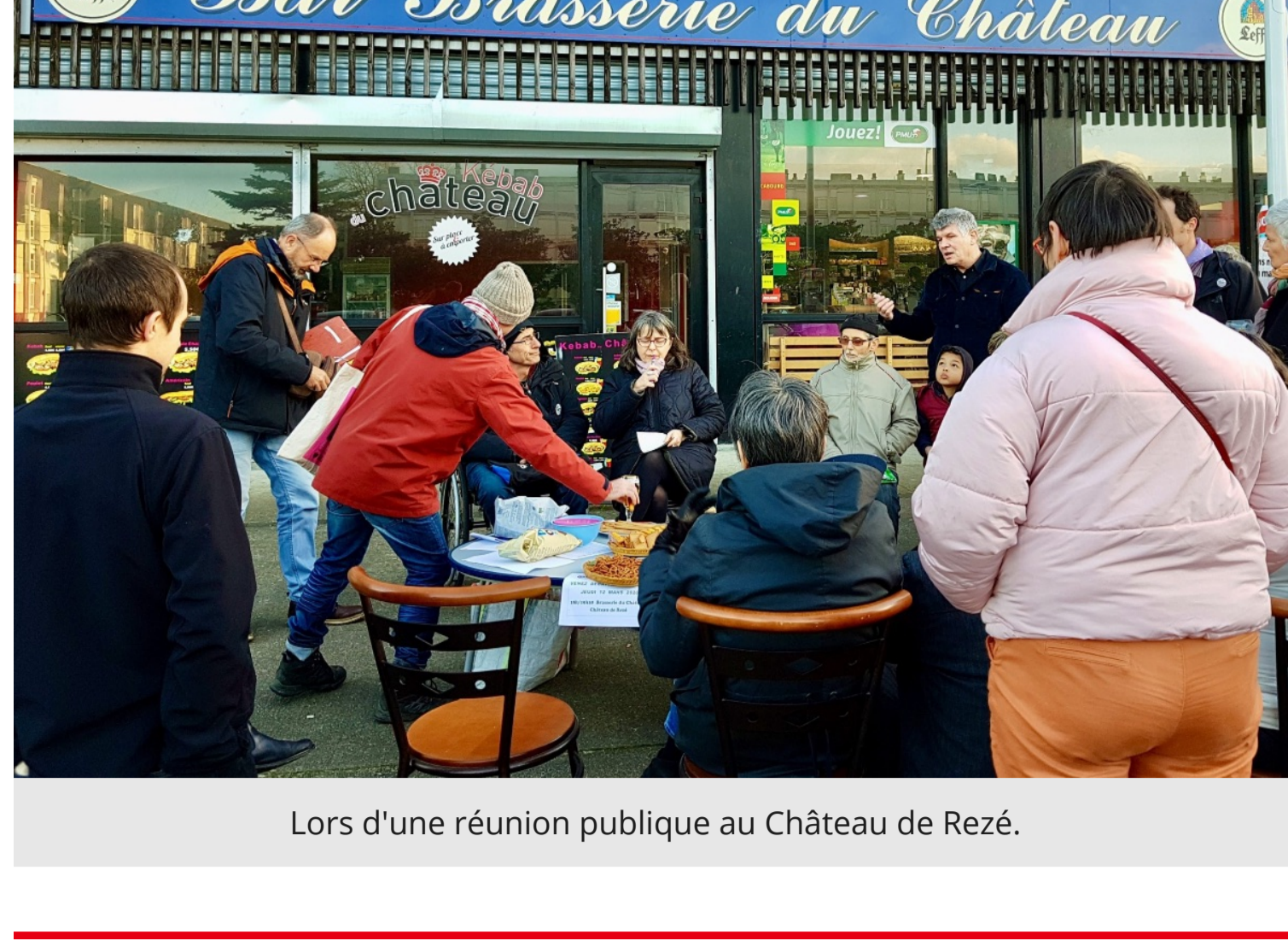
Lors d'une réunion publique au Château de Rezé.

Le premier tour des élections municipales est là !