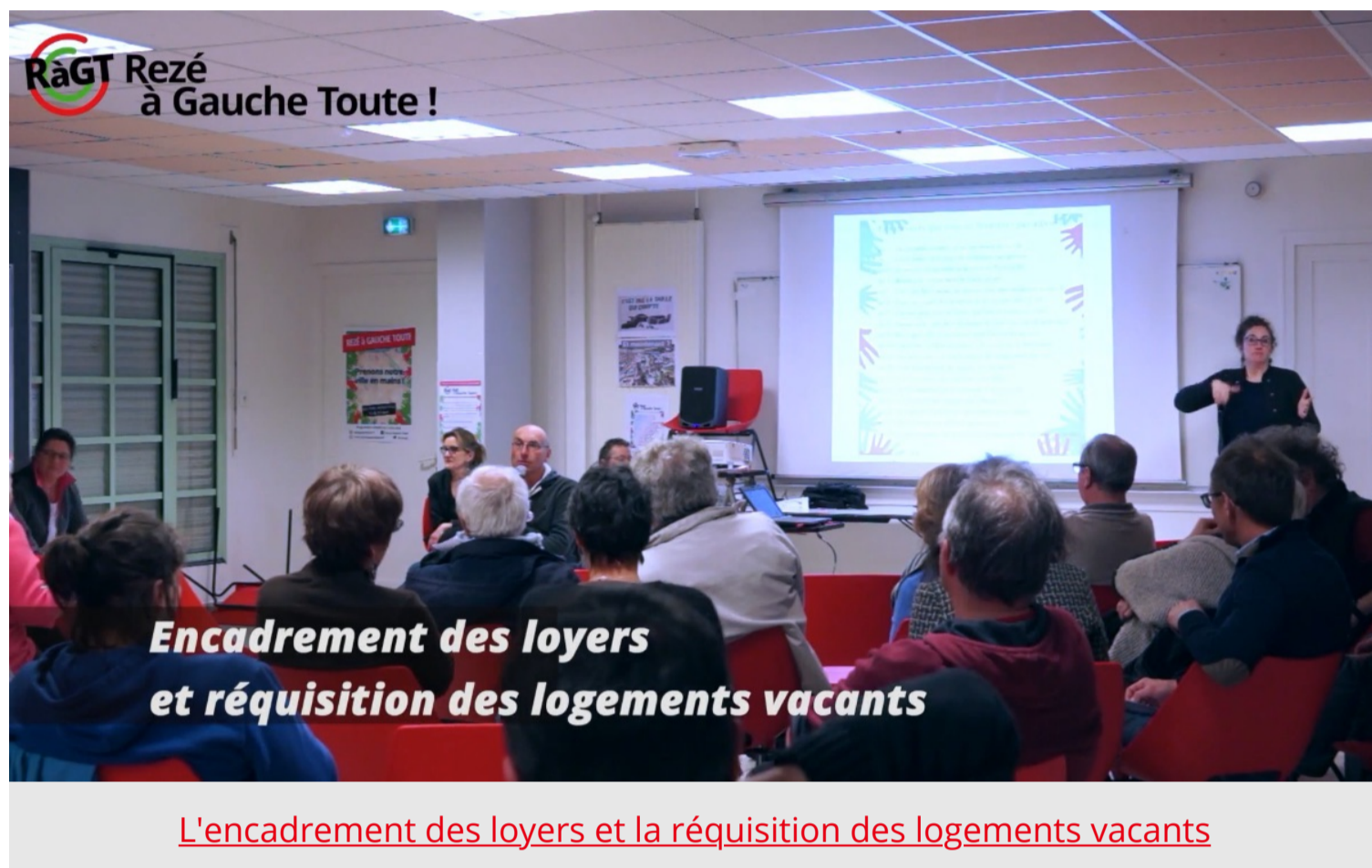
L'encadrement des loyers et la réquisition des logements vacants

Deux courtes vidéos expliquant certaines de nos mesures phares pour Rezé.